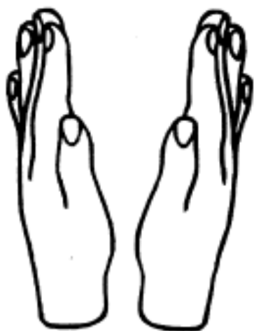
clap clap aplausos

Encierra lo que observa y decora con plastilina.