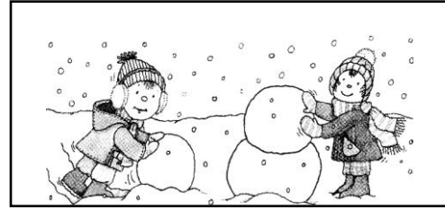
¡ frío !