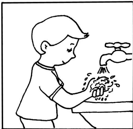
Lávate las manos antes de comer cualquier alimento.