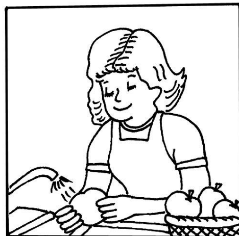
Lava bien tus frutas y verduras