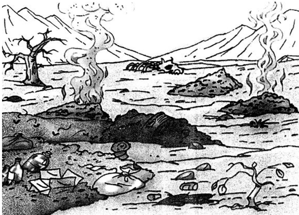
La basura quemada contamina el aire