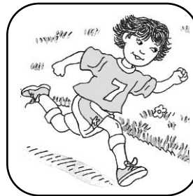
Mauro corre en el parque.