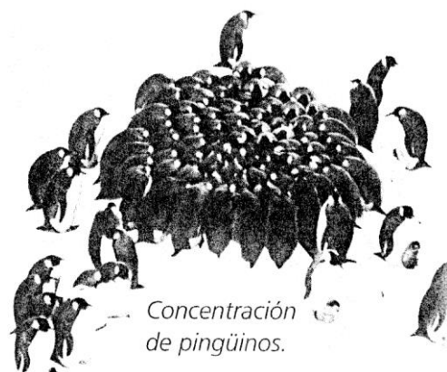
Concentración de pingüinos.

“Llegamos a la Antártida en mayo, justo a tiempo para ver cómo las hembras del pingüino emperador tomaban unas cortas vacaciones hacia el norte dejando a los machos a cargo de una importante tarea: empollar sus huevos. Como estos no pueden sobrevivir sobre el hielo, el macho los incuba sobre sus pies. No puede moverse y mucho menos buscar alimento. Para mantener abrigados a sus futuros polluelos, los machos se apretujan unos a otros moviéndose apenas. Las hembras regresan en julio, a tiempo para recibir a los polluelos, y encuentran a sus esposos muy flaquitos”.