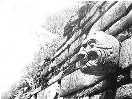
La cabeza-clava del templo de Chavín.

Cómo construyeron el templo. En una primera etapa se levantó el templo Antiguo, en forma de “U”. Dentro de él se construyó una red de galerías que comunicaban a cuartos. Y es en estas galerías donde se encuentra el Lanzón, una escultura enorme donde se representa a la divinidad de dicho templo. En la segunda etapa se construyó el templo Nuevo o castillo, donde lo que más destaca es la portada de las Falcónidas.