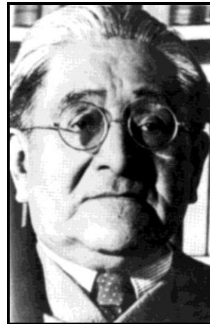
Julio C. Tello